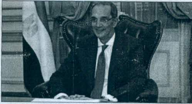
وزير الاتصالات الدكتور عمرو طلعت